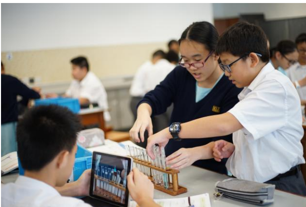
電子學習+合作學習