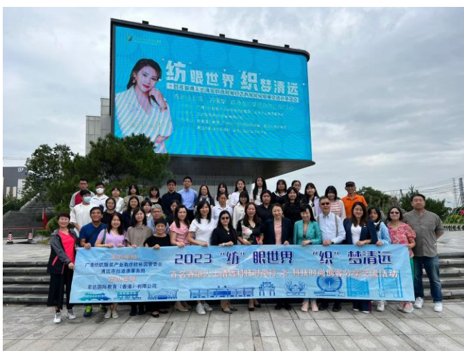
“紡”眼世界，“織”夢清遠